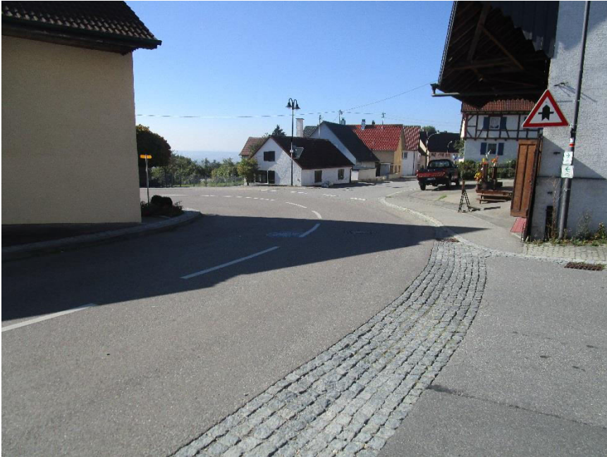
Gefahrenstelle 1: Kurve an der Kreuzung Ortsstraße, Zum Bussen und Im Winkel

⚠ Eine besondere Gefahrenstelle besteht an der Kurve in der die Straßen Zum Bussen und Im Winkel in die Ortsstraße einmünden. Diese Kurve ist für die Schüler/innen sowie für die Autofahrer sehr unübersichtlich. Die Schüler/innen müssen beim Überqueren der Ortsstraße und auch der einmündenden Straßen besonders Acht geben.